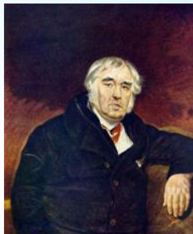
2 Крылов И.