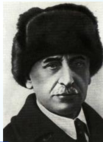
1 Житков Б.