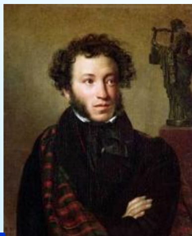
3 Пушкин А.