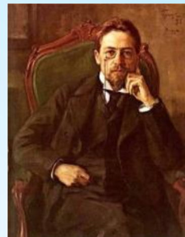
5 Чехов А.