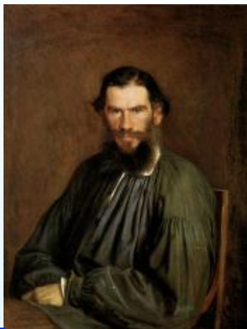
4 Толстой Л.

Напиши фамилии писателей в алфавитном порядке.